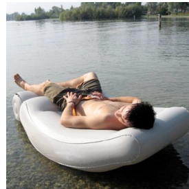
LOUNGE SEAT: CHF 149.00 (inkl. MwSt., inkl. Versandkosten)

Fun-Care AG Untermüli 3 CH-6300 Zug Tel. +41 41 769 30 03 Fax +41 41 769 30 01 Email: info@fun-care.ch Web: www.fun-care.ch