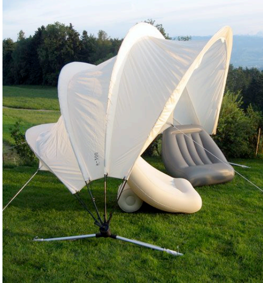
WOGG – PAVILLON: CHF 398.00 (inkl. MwSt., inkl. Versandkosten)